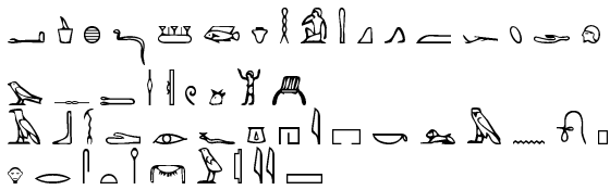
The Hieroglyphics Font (Archaic Font) by Peter Wilson